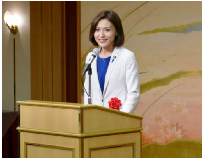
総務大臣政務官 金子めぐみ様

総会後の懇親会では、総務大臣政務官の金子めぐみ様から当推進会議への期待が述べられ、関係省庁・団体を含む ITS 関係者と推進会議会員が交流を深めるとともに、自動運转向け通信システムの実用化においても世界に先行する決意を強くしました。