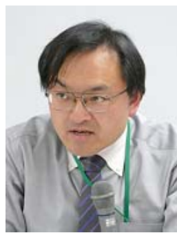
相模女子大学 湧口副委員長