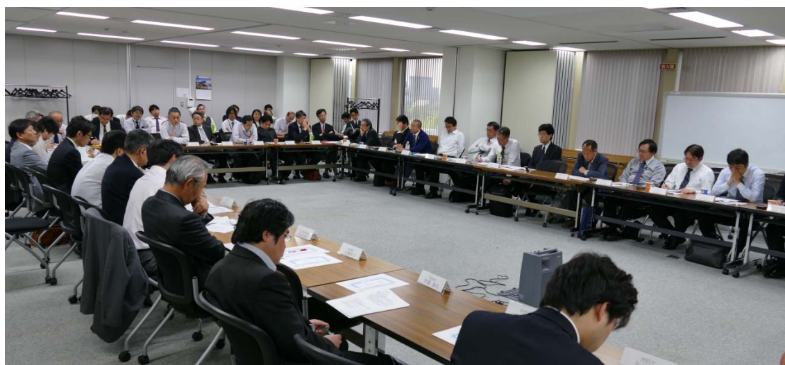
自営無線通信調査研究会 第 9 回会合の様子

1 つ目のテーマでは、東京電力パワーグリッド様から「電力スマートメータの現状」について、2 つ目のテーマでは、委員長から「平成 28 年度の活動まとめ（技術面）」、副委員長から「平成 28 年度の活動まとめ（制度、経済面）」、共同利用WG副主任から「共同利用WGの検討状況」についてプレゼンテーションいただき、活発な意見交換が行われました。