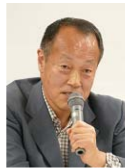
電気通信大学 古谷WG副主任